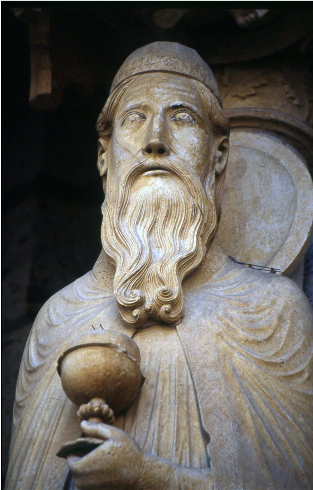
El Rey Melquisedec