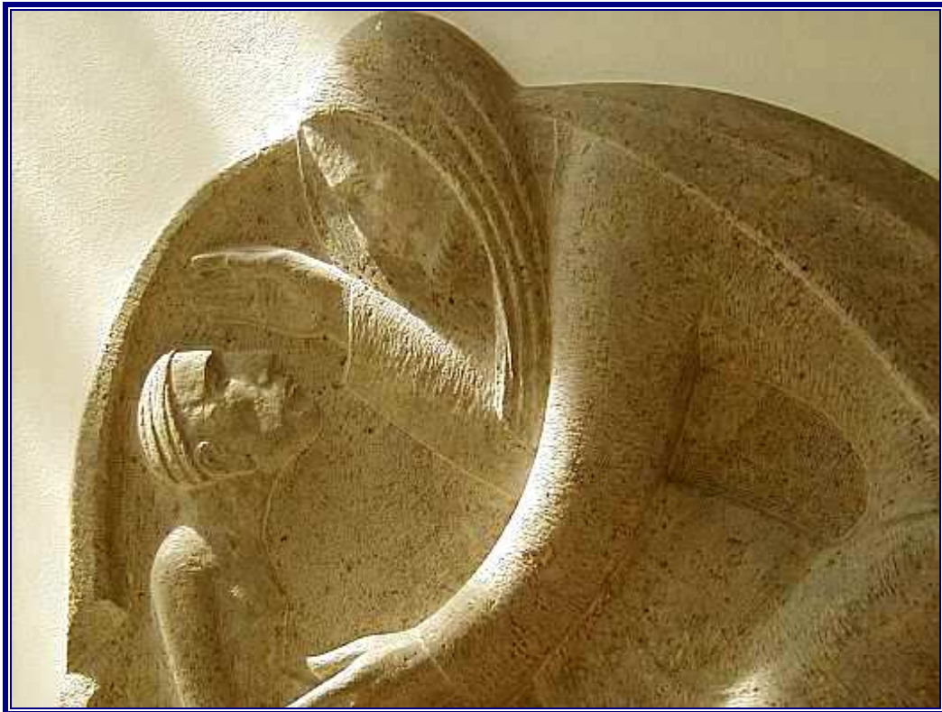
Jesús cura al ciego Bartimeo