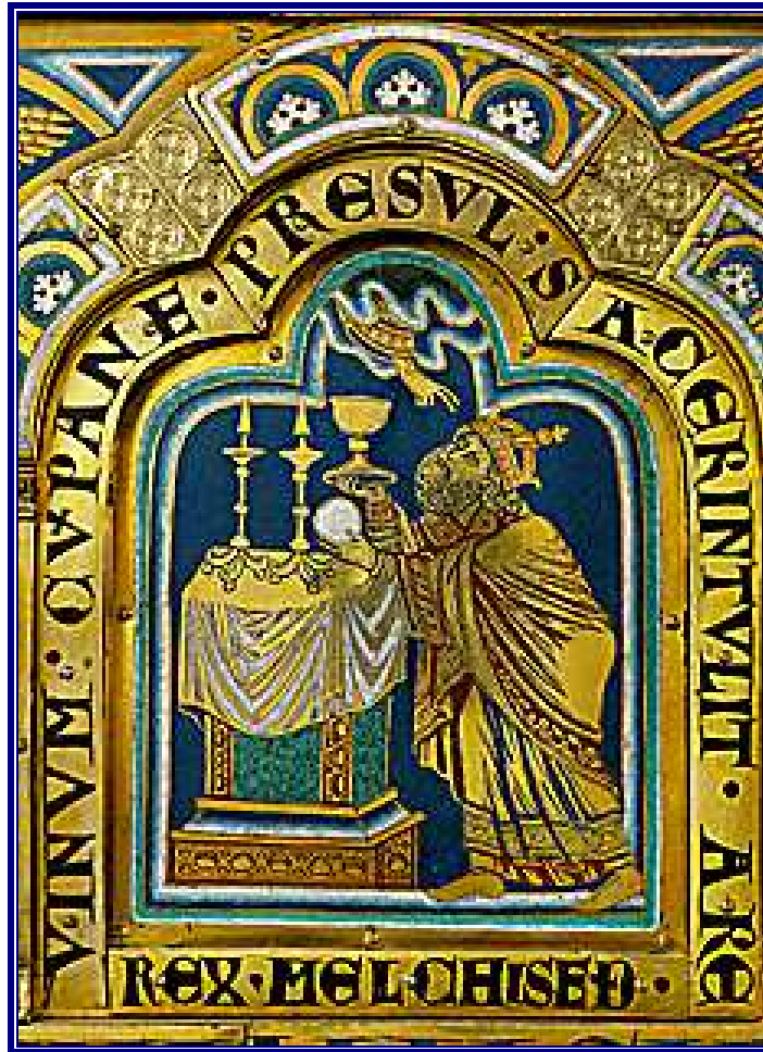
El Rey Melquisedec

Autor: Nicolás Verdún, siglo XII. Esmalte champlevé