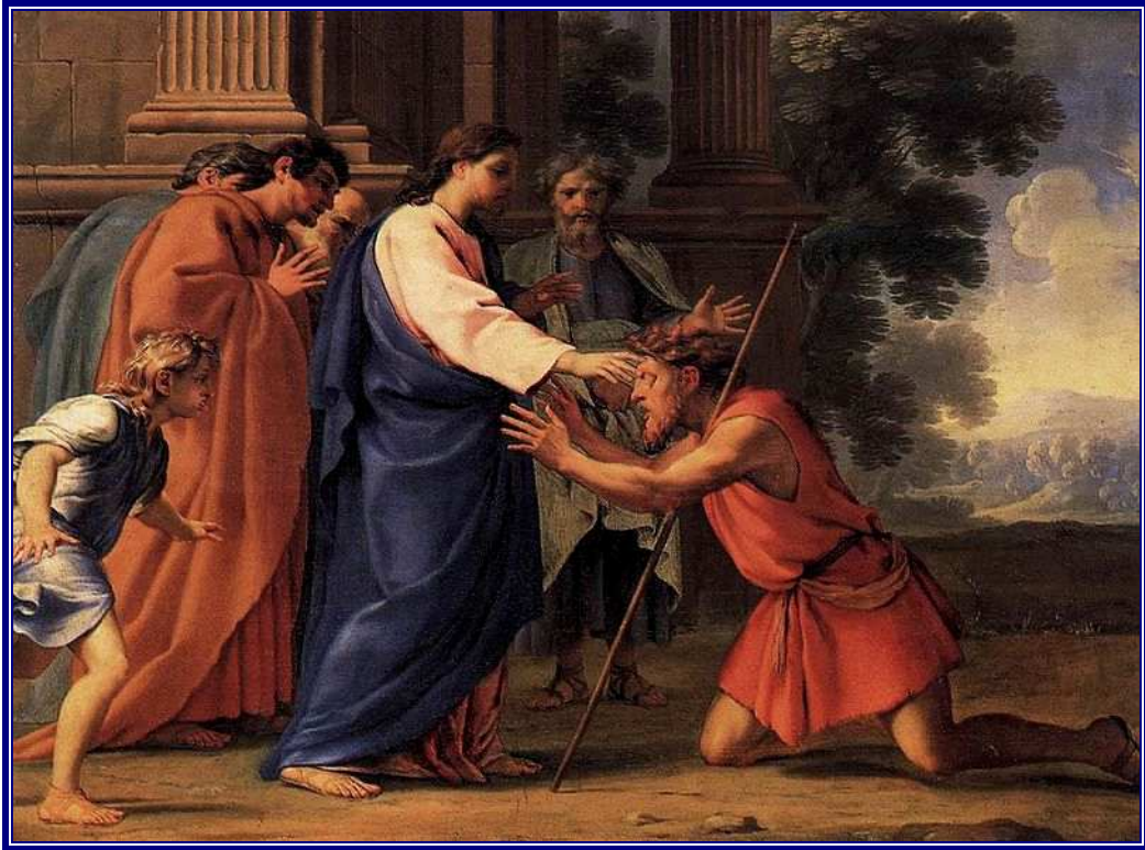
La curacion del ciego Bartimeo