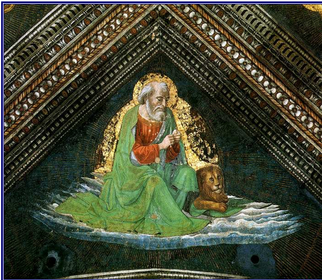
San Marcos Evangelista