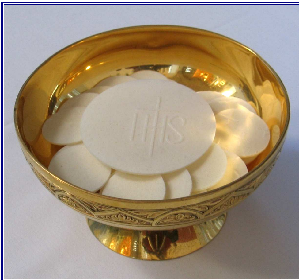
Pan eucarístico de la Iglesia