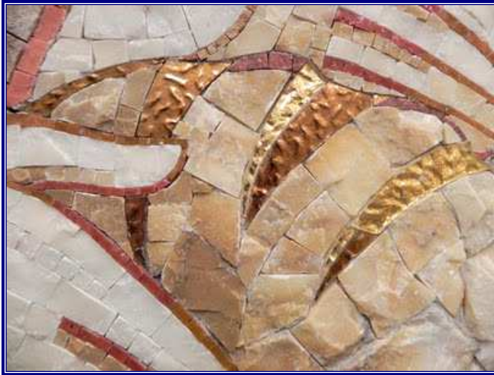
El Pan de Vida. Detalle