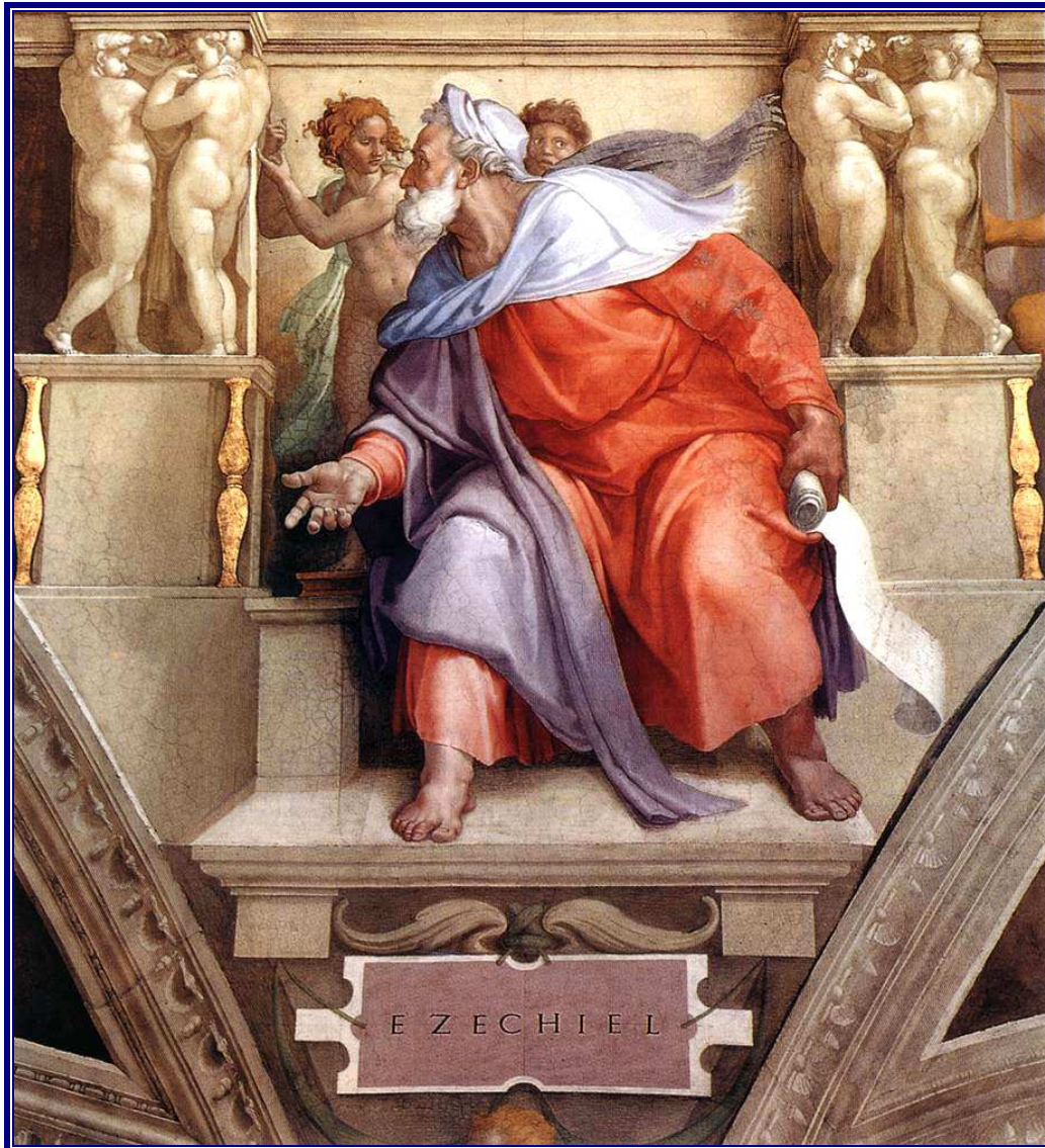
Der Prophet Ezechiel