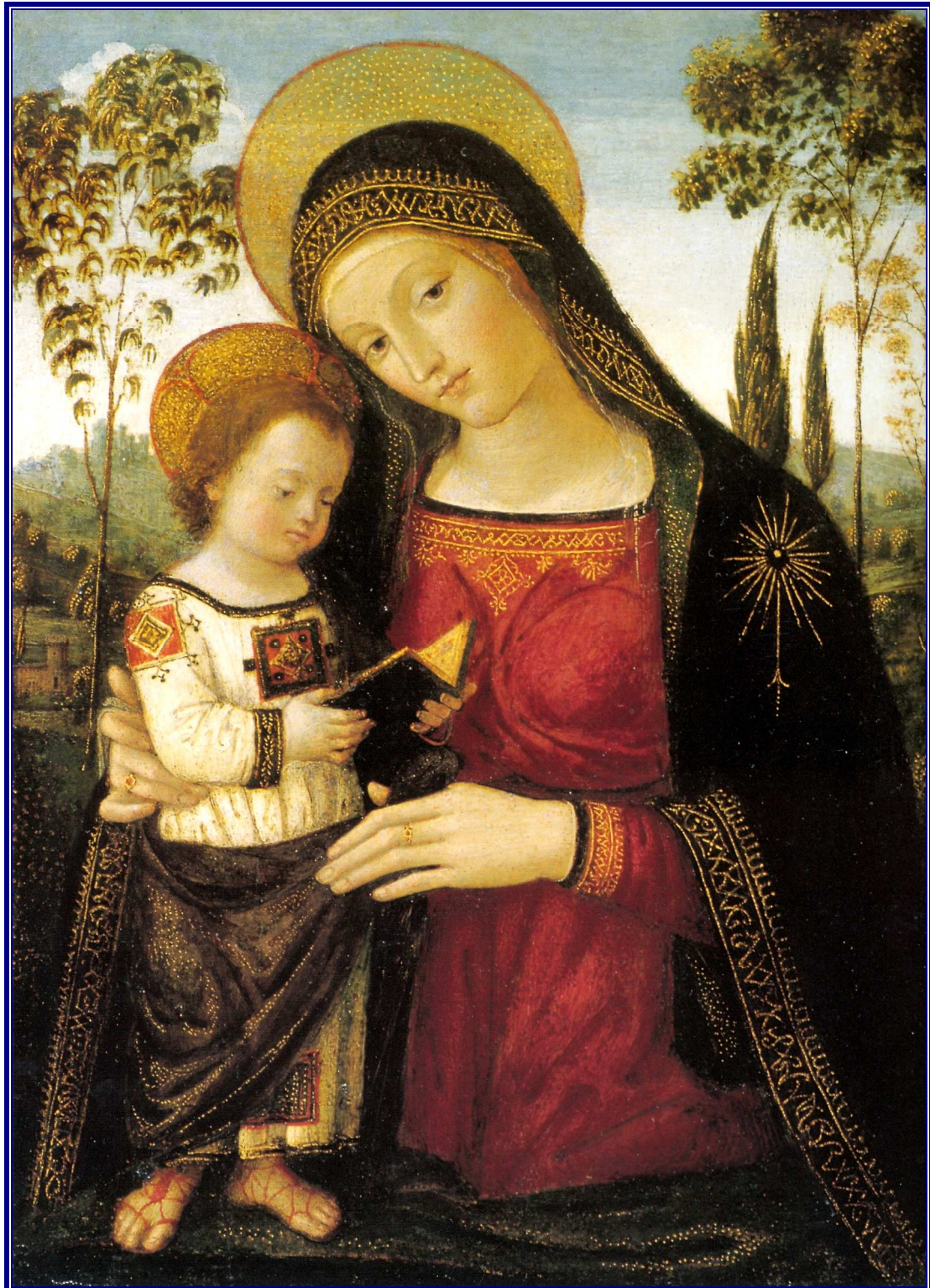
Madonna con el Bambino Autor: Pintoricchio, siglo XVI