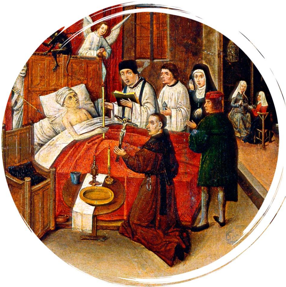
Mesa de los Pecados Capitales. Avaricia y tondo de la muerte

Autor: Hieronymus Bosch, el Bosco, año 1480