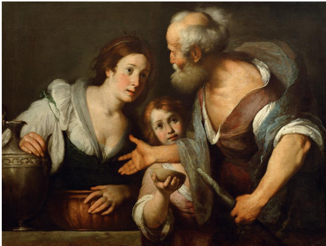
Elias y la viuda de Sarepta Autor: Bernardo Strozzi, siglo XVI