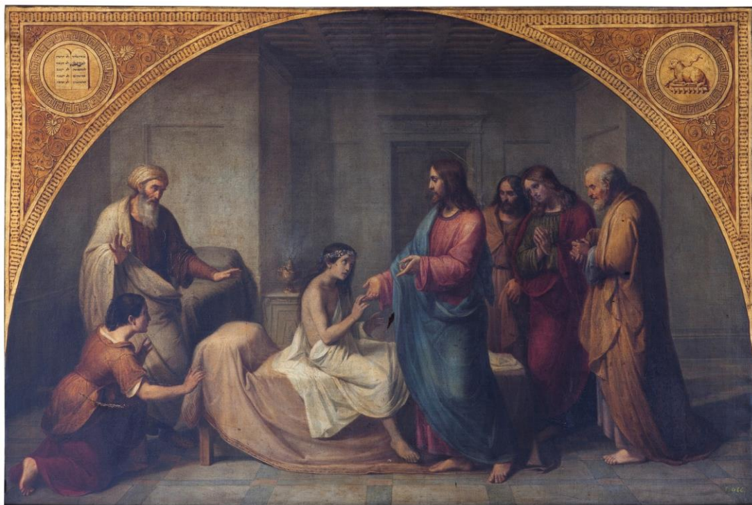
La Resurrección de la hija de Jairo Autor: Benito Saéz, hacia 1838 Museo Nacional del Prado. Madrid 1 febrero