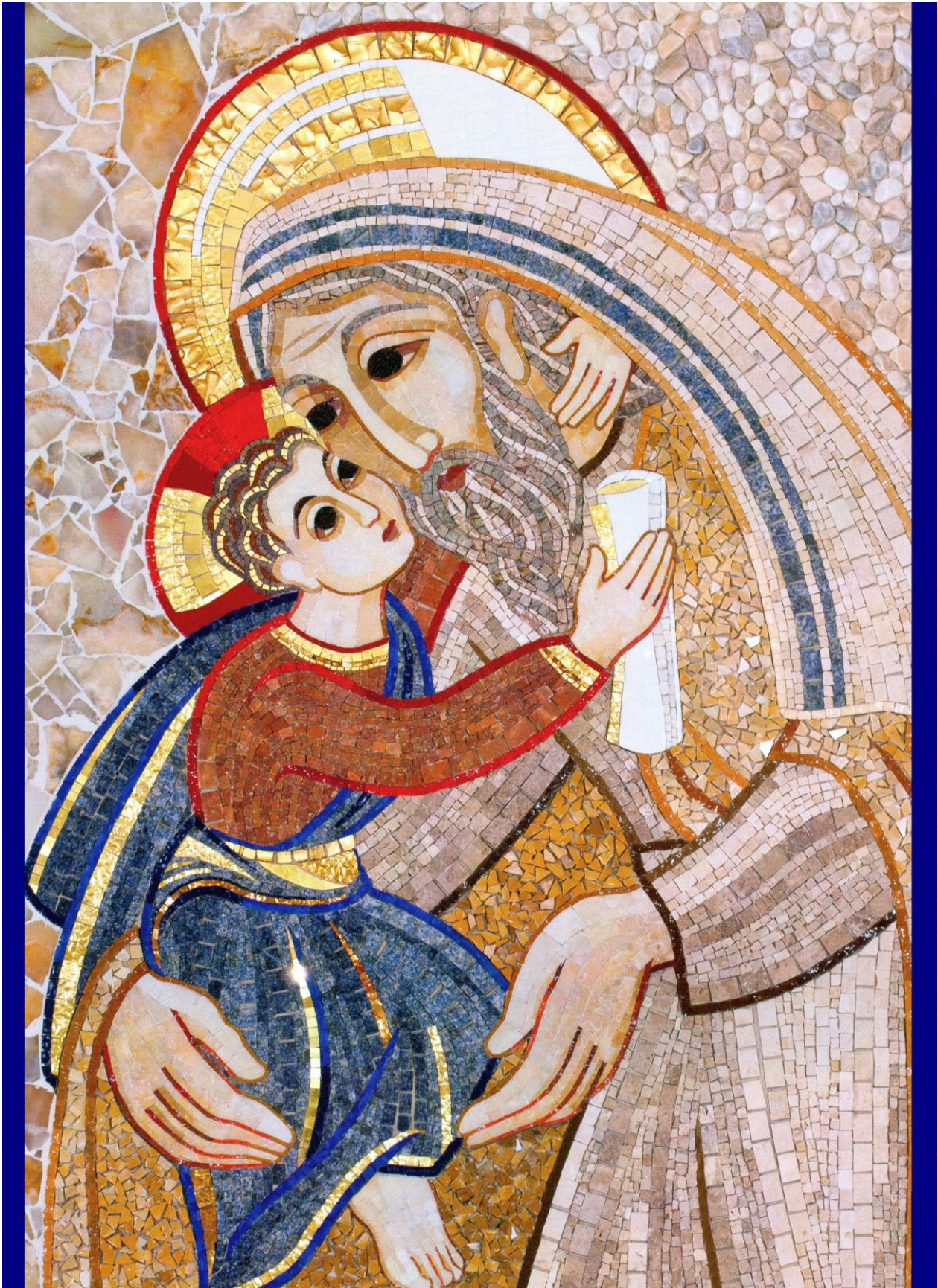
Simeón con Jesús en el Templo