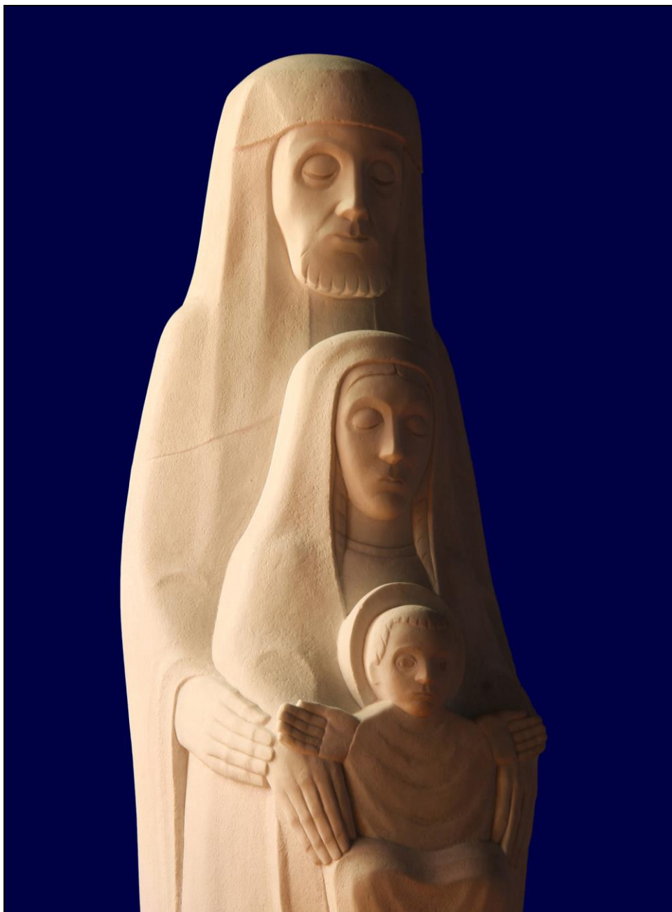
San José, protector de la Sagrada Familia