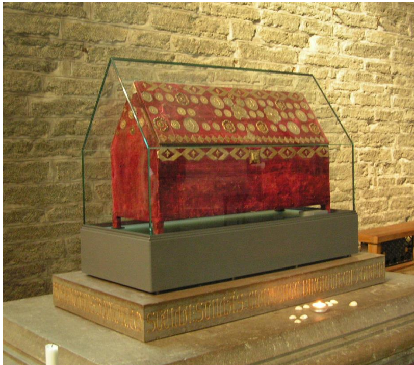
Santa Brígida de Suecia y su relicario