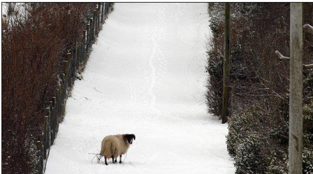
Oveja perdida sin pastor