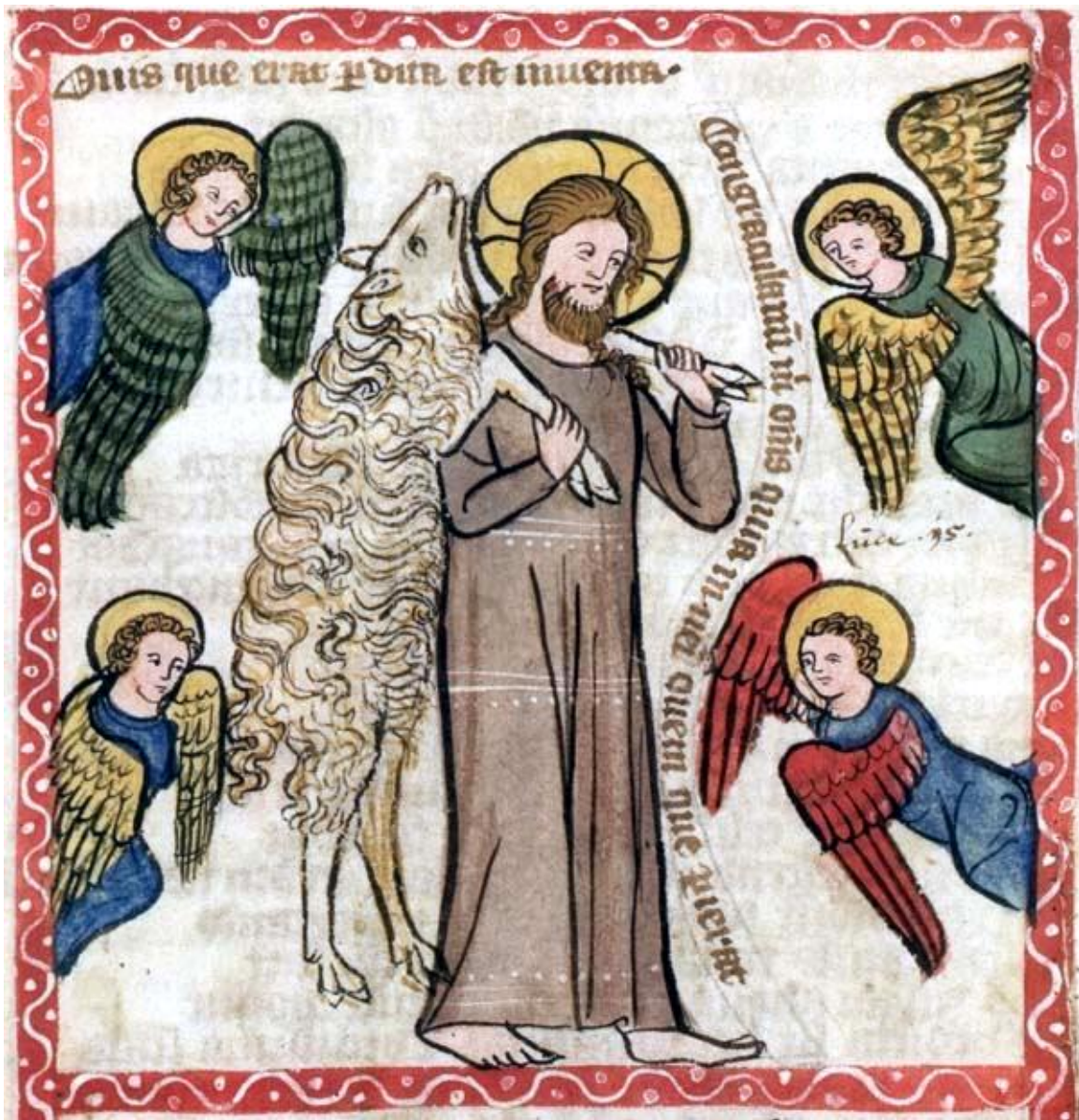
El Buen Pastor