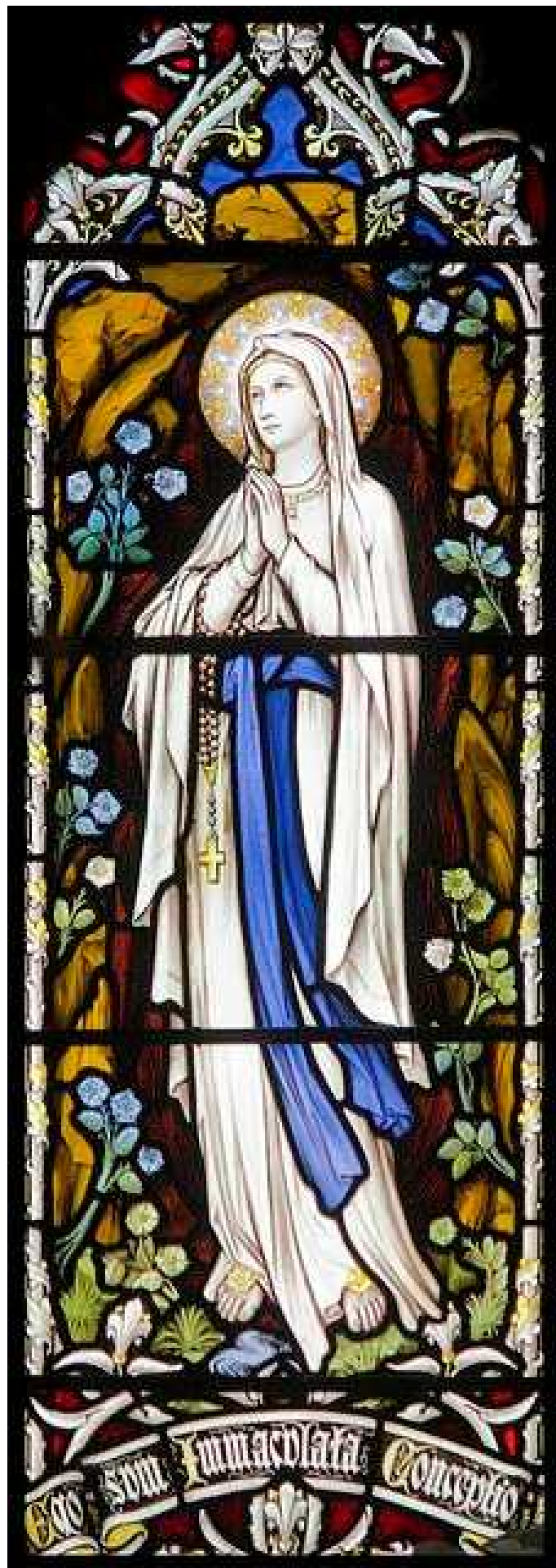
Virgen de Lourdes