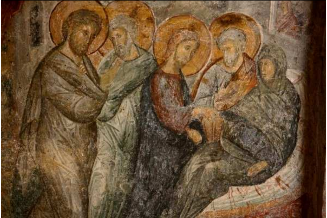
Heilung der Schwiegermutter des Petrus

Byzantinisches Fresko in der Ruinenstadt Mystras, Griechenland