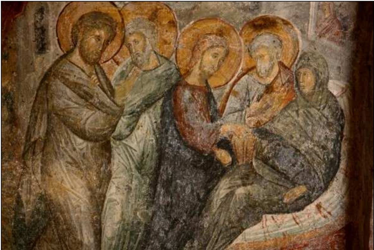
Curación de la suegra de Pedro